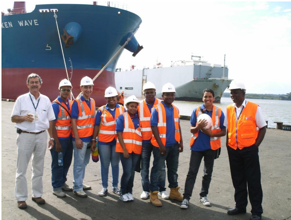
Visita realizada por estudiantes universitarios de Logística Portuaria al Terminal Marítimo

Se destaca el concurso de las empresas del sector portuario que ratificaron su compromiso con la formación de los estudiantes a través de visitas de aprendizaje, lo que les permite asimilar en corto tiempo los procesos que interactúan en el campo de la logística internacional y familiarizarse con la actividad portuaria. Resaltamos empresas como Grupo Coremar, Grupo Portuario y nuestra empresa Sociedad Portuaria Regional de Buenaventura. Otras compañías y gremios como Interpres S.A., Maersk Line, y Colfecar, entre otras, manifestaron su interés de transmitir sus experiencias a los jóvenes que hacen parte de este proyecto.