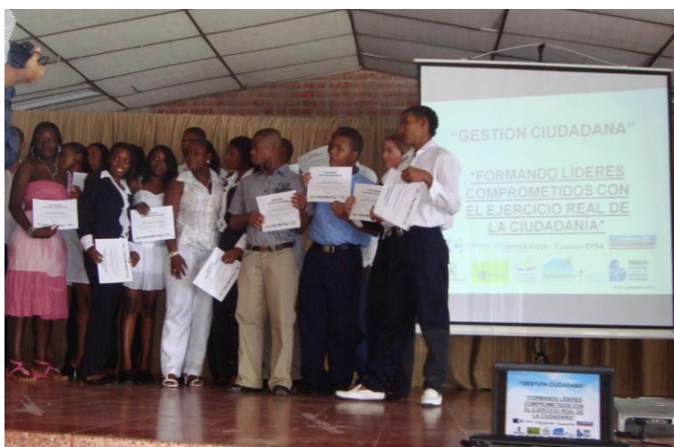
Evento de Clausura de la Fase III del proyecto Gestión Ciudadana

Cabe resaltar que este proyecto fue desarrollado en ocho municipios del Valle del Cauca destacándose Buenaventura como el de mejores resultados, según el coordinador general vinculado con la Fundación Smurfit Cartón de Colombia, entidad participante.