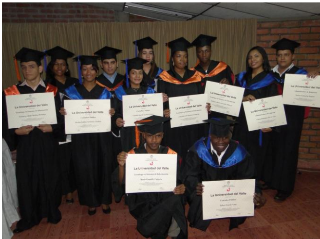
Segunda Promoción de la Universidad del Valle sede Pacífico

En Educación Superior 30 nuevos profesionales y tecnólogos obtuvieron su título por parte de las Universidades del Valle sede Pacífico, del Pacífico y Libre. De ellos el 20% se graduaron como los mejores estudiantes de las universidades donde adelantaron sus estudios, resultado del excelente rendimiento académico obtenido durante la carrera.